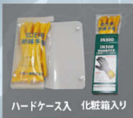
ハードケース入 化粧箱入り